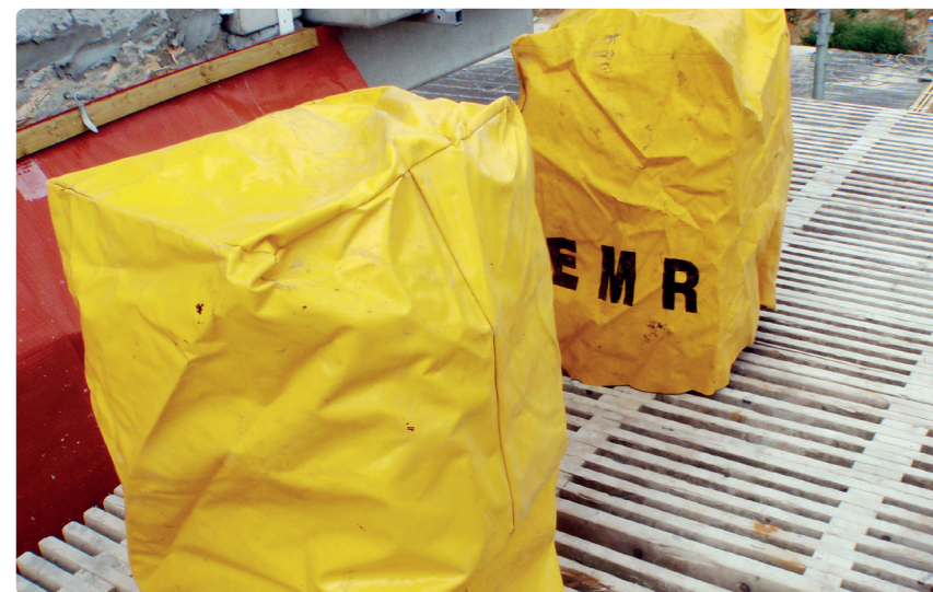
Plasthætter er bedst egnet til at beskytte udpakkede stenhoveder.