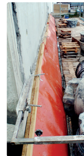
Afdækningen skal være tætsluttende ind mod en allerede opført bagmur, således at regnvand ikke ledes ned i isoleringen.